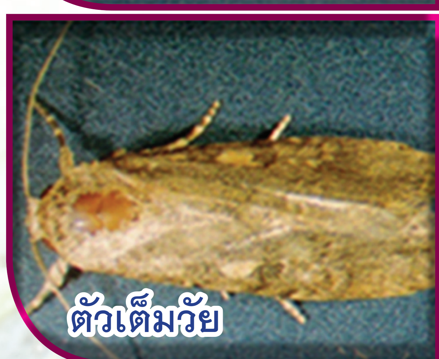
ตัวเต็มวัย